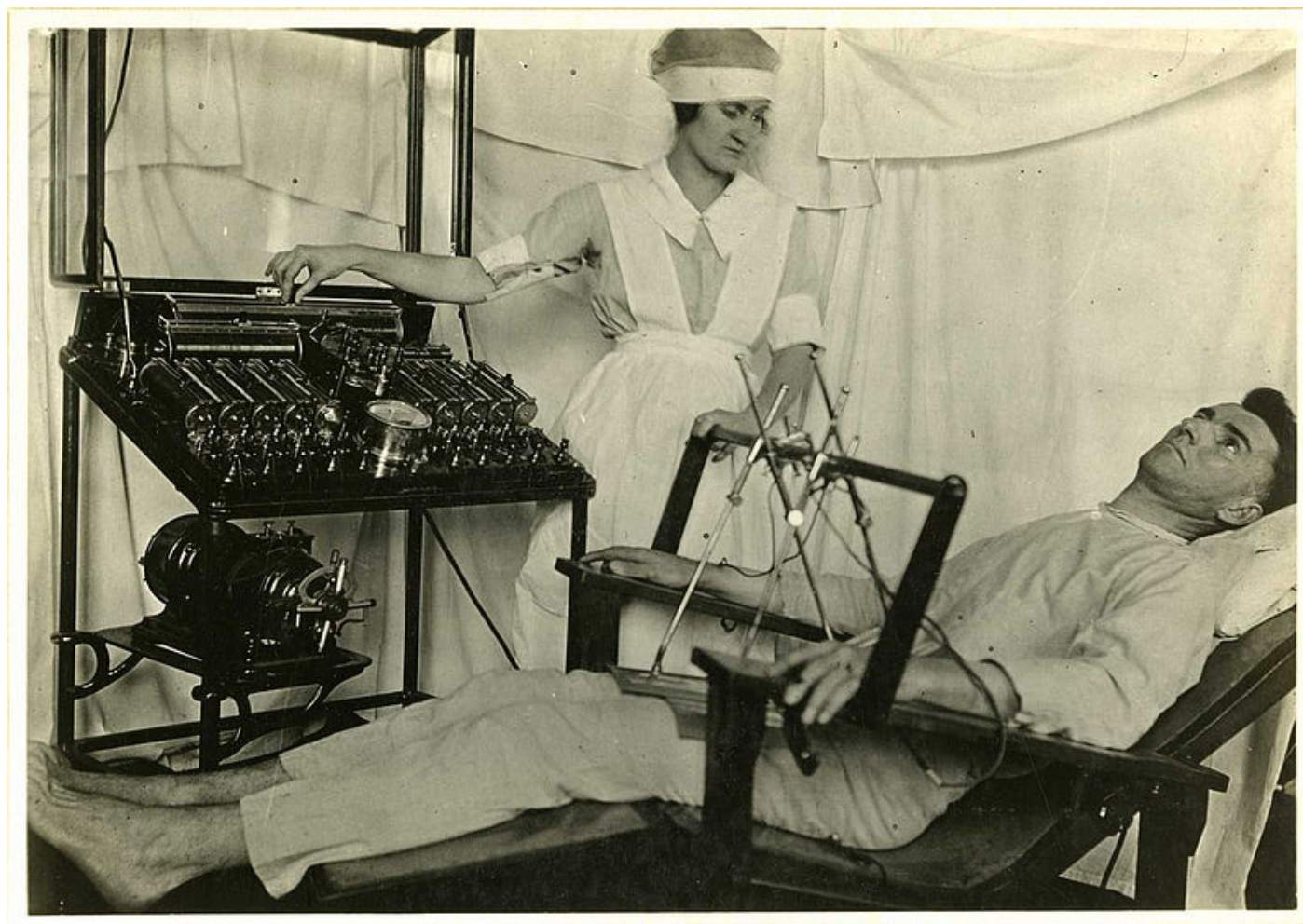
טיפול בחולי נפש באמצעות בשוק חשמלי בתקופת מלחמת העולם הראשונה.

לעוד חולה במערכת הבריאות. חלקנו ממריאים בפנטזיה וחולמים שאולי אז נוכל לפרוץ אל התודעה הציבורית בצבעינו האמיתיים.