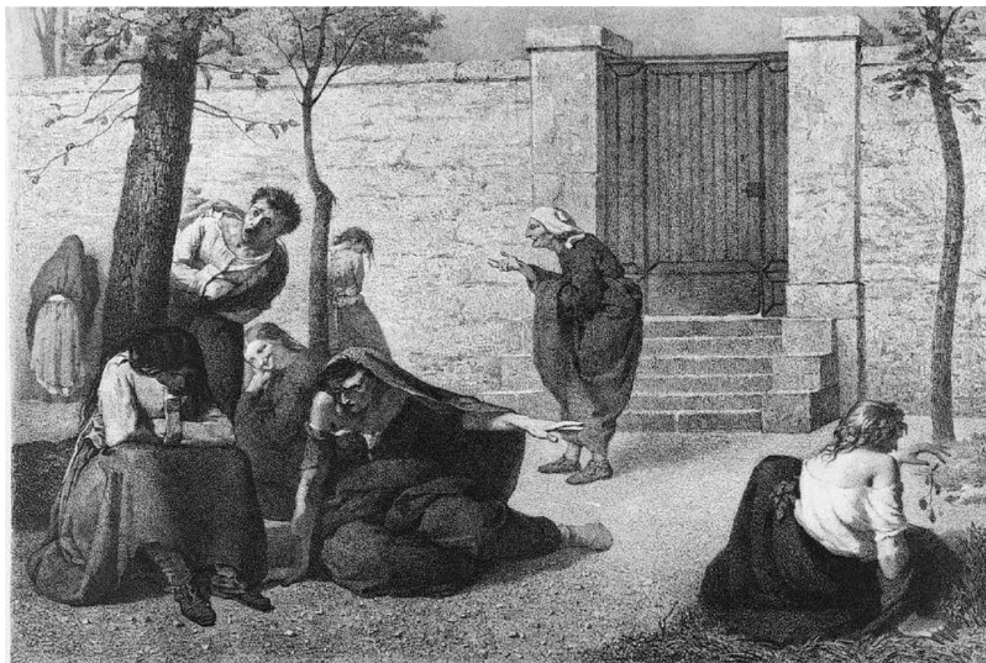
איור של ארמנד גוטייה משנת 1857 המתאר האנשה של מחלות נפש שונות.

אפשר לגשת אל העניין מהכיוון ההפוך ולשאול, מי מרוויח מהגישה הזאת? ישנם החשודים המידיים – חברות התרופות, הפסיכיאטרים הראשיים וכדומה. אבל מעניין להכיר בכך שגם אנשים כמוני וכמו רילי ווילו מרוויחים מהפרדיגמה הביולוגית. ודאי אשמע ציני אם אומר שאנחנו מקבלים הכרה יותר מלאה לנפשנו, אבל זו האמת. באופן אירוני, אם אנחנו מתמודדים עם מחלה קשה, בלתי מוסברת וחשוכת מרפא, אנחנו גיבורים גדולים יותר. זה יכול להעשיר את התדמית החברתית שלנו. אני, לדוגמה, יכול לגרוף הון חברתי לא קטן מחשיפה לעיני כל של נסיוני האישי המר.